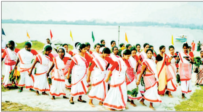
लोककला, संगीत और बोनफायर नाइट्स से सजेगा हर शाम का माहौल: हर शाम बोनफायर नाइट्स में जनजातीय लोकनृत्य, संगीत और हंसों से भरी संध्याएं होंगी। पारंपरिक गीतों की धुन और आग की लपटों के बीच साझा होती मुस्कानें इस आयोजन को आत्मीयता का नया अर्थ देंगी। फेस्टिवल में स्थानीय व्यंजनों का विशेष स्टॉल आकर्षण का केंद्र रहेगा। स्थानीय पारंपरिक पकवानों के स्वाद से ►►शोष पेज 4 पर

यहां आगामी 6 से 9 नवम्बर 2025 तक आयोजित होने वाले 'जशपुर जम्बूरी 2025' में प्रदेश और देशभर से पर्यटक प्रकृति की गोद में ►► शोष पेज 4 पर