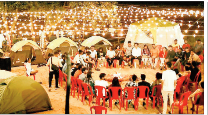
खुले आसमान तले स्टार गेजिंग सेशनस: रात्रिकालीन आयोजनों में स्टार गेजिंग सेशनस विशेष आकर्षण होंगे। तारों से सजे जशपुर के निर्मल आसमान में सैकड़ों नक्षत्रों को निहारने का अनुभव आगंतुकों को अद्भुत शांति और विस्मय का एहसास कराएगा।