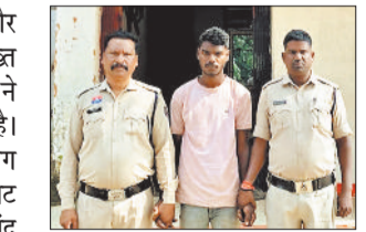
बगीचा पुलिस की त्वरित कार्रवाई

घटना 21 अक्टूबर 2025 की शाम करीब सात बजे की है। थाना बगीचा क्षेत्र के एक गांव की 15 वर्षीय नाबालिग बालिका अपनी सहेली के साथ घर लौट रही थी। इसी दौरान एक मासत इनके गाड़ी में तीन युवक पहुंचे, जो प्रार्थिया के परिचित थे। उन्होंने दोनों बालिकाओं को घर छोड़ने की बात कहकर गाड़ी में बैठा लिया। कुछ दूरी चलने के बाद प्रार्थिया को गाड़ी